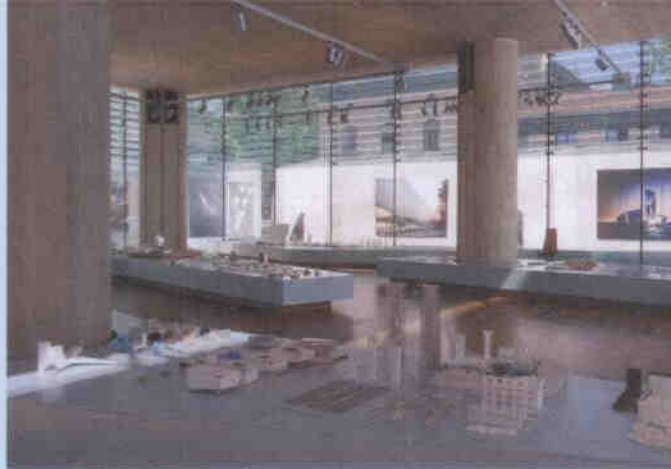
Выставка проектов «Снэкетта». Национальный музей искусства (Архитектура) в Осло, 2009 года.